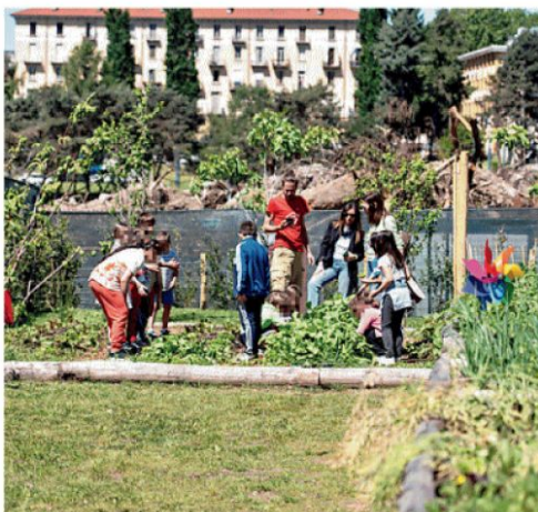
Il nuovo orto è organizzato in tre aree accessibili

L'inaugurazione dell'orto rappresenta il più importante ampliamento di CasaOz degli ultimi quindici anni. Ma per la realtà nata nel 2007 per sostenere famiglie con bambini malati o fragili si tratta soltanto di una tappa di un percorso destinato a proseguire nei prossimi mesi. Subito dopo l'estate Fonda-